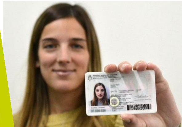
DNI: DOCUMENTO NACIONAL DE IDENTIDAD

¡EN DEMOCRACIA TENEMOS DERECHO A LEER LOS LIBROS QUE NOS GUSTAN!